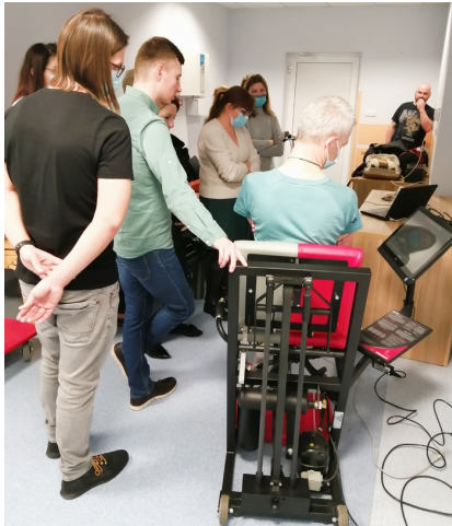
Program Specjalizacji z Rehabilitacji Medycznej