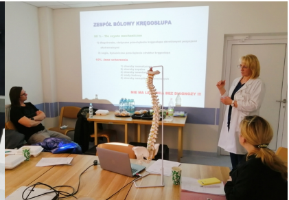
Kursy w ramach Programu Specjalizacji z Rehabilitacji Medycznej