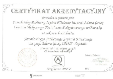
Pierwszy certyfikat akredytacyjny CMJ 2015 r.