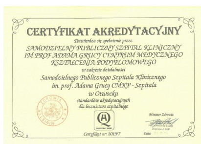
Drugi certyfikat akredytacyjny CMJ 2019 r.

Miło nam poinformować, że SPSK im. prof. A. Grucy CMKP przeszedł w 2019 r. ponownie proces akredytacji Centrum Monitorowania Jakości w Ochronie Zdrowia, uzyskując wynik 90%.