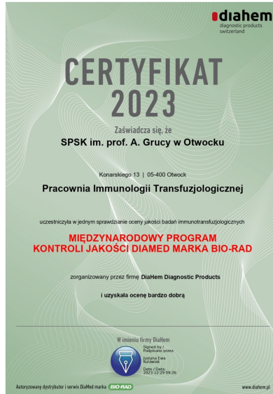
Certyfikat Pracowni Immunologii Transfuzjologicznej 2023 r.