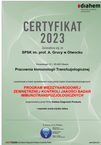
Certyfikat Pracowni Immunologii Transfuzjologicznej 2023 r.