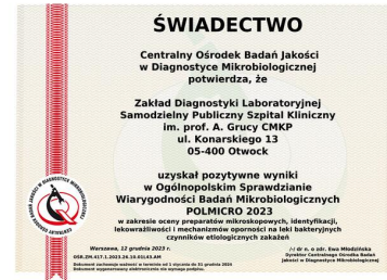
Świadectwo Centralnego Ośrodka Badań Jakości w Diagnostyce Mikrobiologicznej POLMICRO 2023 r.